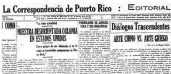
Figura 4. "Arte chino vs. Arte griego", Diálogo trascendente publicado en enero de 1930.

Encabezado: Hay en Patillas una religiosa que practica el Evangelio.